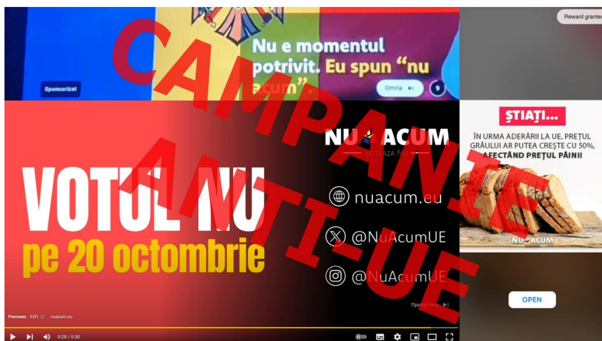
Reclamă anti-UE pe YouTube în Republica Moldova.

Stopfals.md notează că propagandiștii fac trimitere la declarația ambasadorului UE în Moldova, Jānis Mažeiks, dintr-o emisiune televizată, în care fusese întrebat despre comercializarea pământurilor: Acest aspect urmează a fi discutat în cadrul negocierilor de aderare. Într-adevăr, în Uniunea Europeană există libera circulație a capitalurilor, astfel încât orice cetățean dintr-un stat membru poate cumpăra orice într-un alt stat membru.